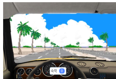
(Fig 1) Run screen in Entry

(Fig. 1)은 엔트리 실행 화면으로 웹카메라가 도로 표지판중 하나를 인식하면 그의 의미에 부합하게 작동이 된다. (Fig. 2)의 각종 표지판들은 엔트리의 인공지능 블록을 활용하여 지도학습을 사전에 진행한다.