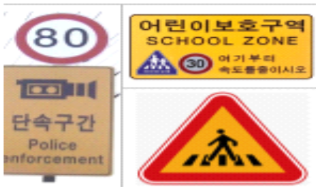
(Fig. 2) Road signs for Supervised Learning