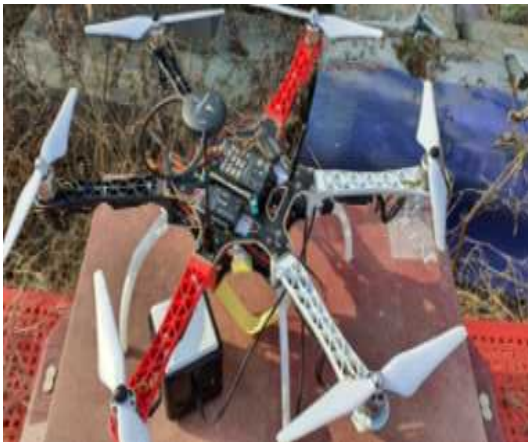
[Fig. 2] setting of measuring equipment [그림 2]. 측정기 탑재

로터가 동일한 방향으로 회전하지 않고 짝을 지어 서로 반대 방향으로 회전하도록 설계되어 있다. 이러한 원리로 드론의 무게와 장착된 배터리 용량에 따라 비행시간이 결정되고 측정 장치의 종류와 범위를 결정하게 된다[3].