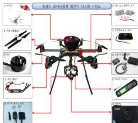
[Fig. 1] System device of drone

드론의 사전적 의미는 항공 안전법 제 2조 3호 “초경량 비행 장치란 항공기와 경량 항공기 외에 공기의 반작용으로 뜰 수 있는 장치로서 자체 중량, 좌석 수 등 국토교통부령으로 정하는 기준에 해당하는 동력 비행 장치, 행글라이더, 패러글라이더, 기구류 및 무인 비행 장치를 말한다. 최초 드론은 배송 또는 이송을 위한 목적으로 이륙 무게에 중심을 두어 발전되었으나 현재는 다양한 기술의 발전으로 인해 영상전송, 방재, 감시, 방위 등 다양한 분야에서 융합의 형태로 진화되고 있다. 현대 과학 기술은 어느 한 분야만 고립, 독자적으로 발전되지 않는 것에 그 특징이 있으며 예로 드론과 AI 융합을 그 예로 들 수 있다.