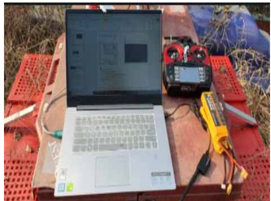
[Fig. 4] collection method of measurement [그림 4]. 측정 데이터 수집