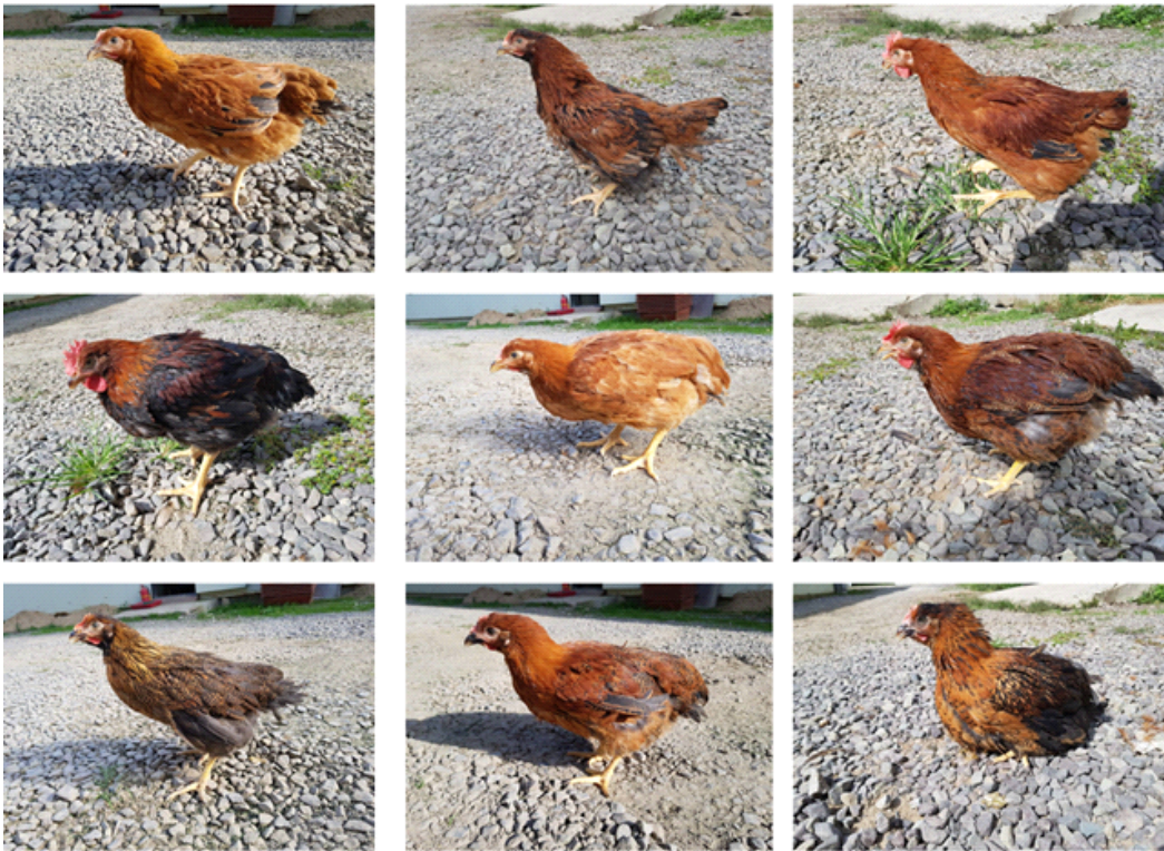
Fig. 1. The representative feather colors of Korean native crossbred commercial chickens

측정치의 유의적 차이가 인정되는 경우 각 조합 간 평균값의 비교는 Tukey's HSD 검정 방법으로 분석하였고, 조합별 일령에 따른 체중의 회귀함수는 동일 패키지의 regression procedure를 이용하여 추정하였다.