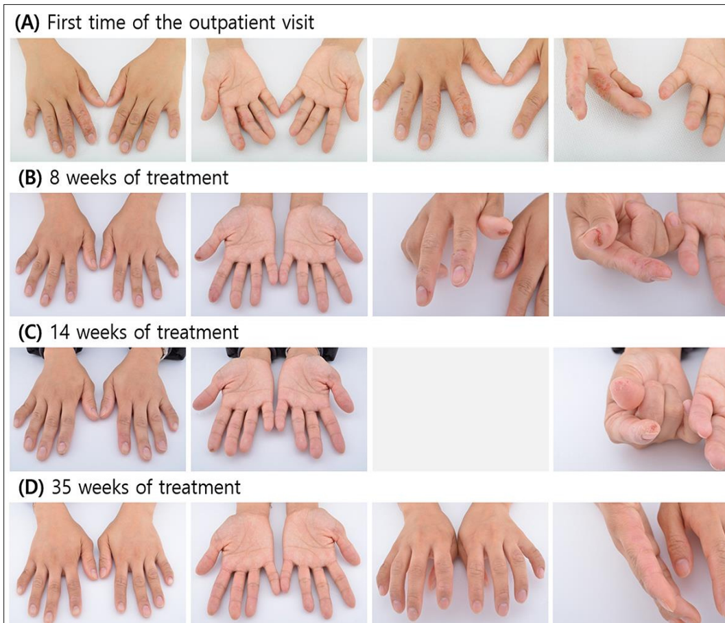
Figure 1. Changes in skin symptoms according to the course of treatment

빠른 증상 경감을 보였다. 치료 22주 후 제반 피부 증상 소실되어 탕약 복용 하루 2회에서 1회로 변경하였고, 간혹 소양감 발생하는 정도로 양호하게 유지되어 치료 32주 후 한약 및 양약 복용을 중단하였다. 복용 중단 이후 약 15주 동안 추적 관찰한 결과 간혹 발생하는 경미한 소양감 외 제반 증상 호전 상태를 유지 중이며, 환자 주관적인 평가로 초진 대비 90% 호전되어 치료 종결하였다(Figure 1D).