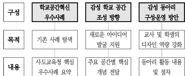
Figure 2. Contents of Guideline

마지막으로 앞에서 언급했던 것과 같이 학교공간혁신사업은 학생 의견을 적극적으로 수렴해야하므로 공모 단계 이전부터 건축 및 디자인 동아리를 운영할 수 있도록 『동아리 구성 및 운영 가이드라인(가칭)』을 개발할 필요가 있다.