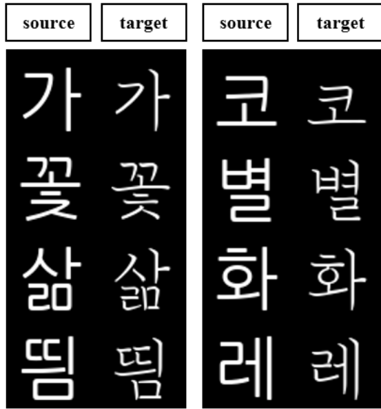
Fig. 3. Example of Input Dataset Image for Deep Learning Applications (SDKorFont)