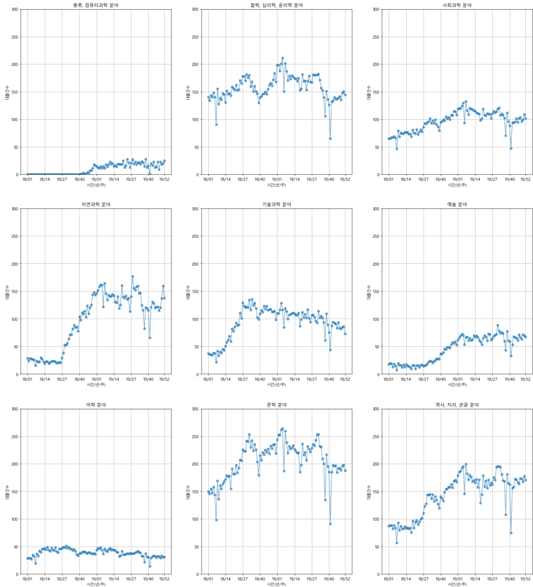
〈그림 3〉 내용분류별 베스트셀러 도서 대출 건수 합계 평균의 변화