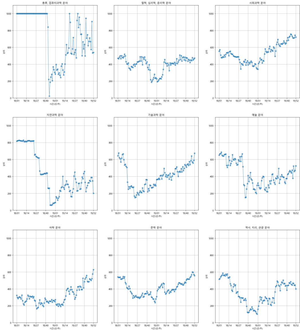
〈그림 2〉 내용분류별 베스트셀러 도서 평균 순위 변화

이러한 경향은 앞서 베스트셀러 도서의 평균 순위 변화가 'U자' 형태를 보이는 것과 상반되는 것을 알 수 있다. 종합하면, 도서의 베스트셀러 순위의 변화('U자 형태')와 대출 건수 합계 평균의 변화('뒤집어진-U자 형태')를 시각적으로