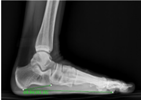
Fig. 1. Measurement of the calcaneal pitch angle.