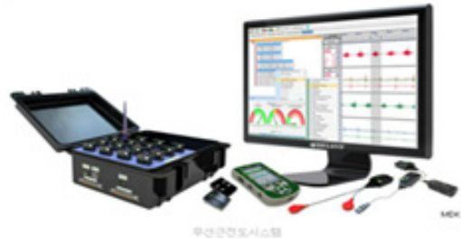
Fig. 2. Wireless EMG system.