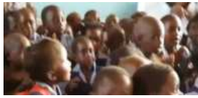
Fig. 3. Meeting them is the best choice in a new life start.