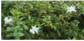
Fig. 2. A commitment that gives them happiness.

10건이었으며, 그 사진과 설명은 다음 Fig. 2- Fig. 13과 같다.