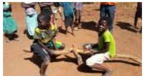
Fig. 6. Help them grow their happiness and their dreams.