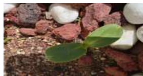
Fig. 7. Save lives and sprout hope buds.