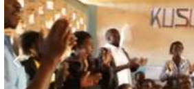
Fig. 5. Rewarding to all local people.