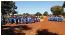
Fig. 8. I am rewarded with children's waiting and earnest hope.