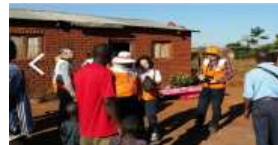
Fig. 11. NGO overseas service contributes to the region with international social welfare.