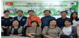
Fig. 4. Taegeukgi raises the status of the country.