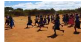
Fig. 9. A great reward for small service.