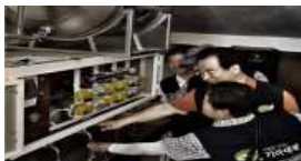
Fig. 10. Overseas service through NGOs is a secure service.