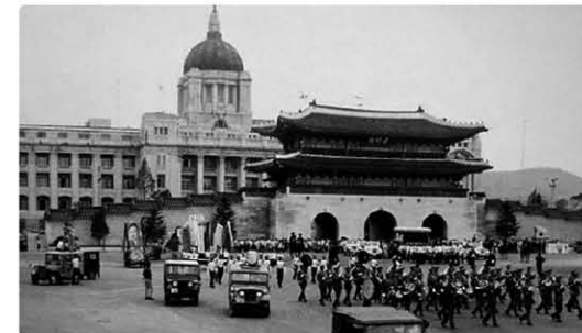
콘크리트로 복원된 네 번째 광화문 준공식(1968년)