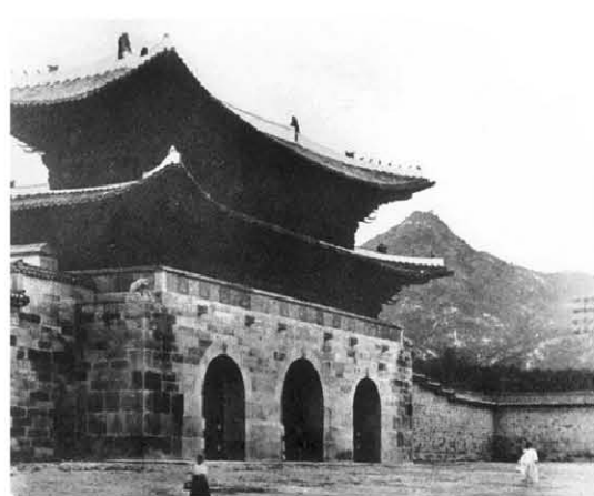
이전(1927년)된 세 번째 광화문