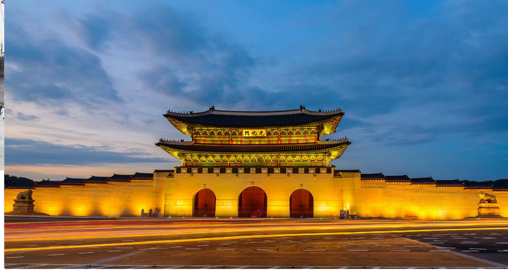
전통 목구조 방식으로 본래 위치와 방향으로 복원(2010년)된 다섯 번째 광화문