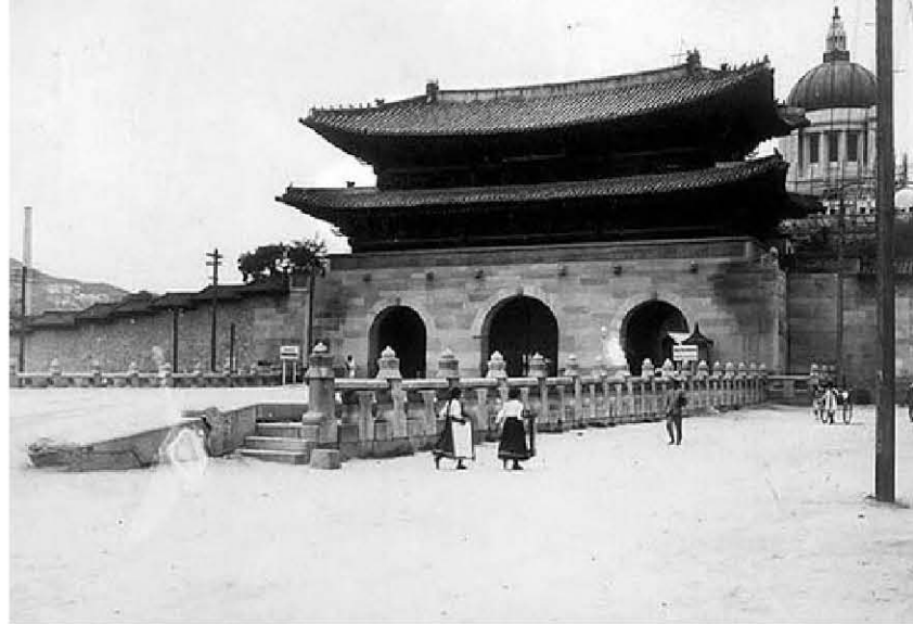
이전(1927년)되기 직전의 세 번째 광화문