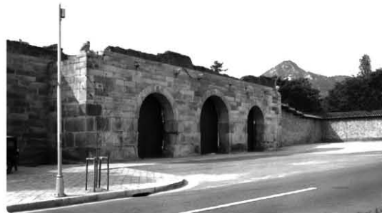
콘크리트로 복원되기 직전 세 번째 광화문(1967년)

대한민국 시기에 전쟁과 복원 그리고 철거와 재축까지 다사다난했던 광화문은 조선의 건축물이었다. 그렇다면 조선시대의 광화문은 어땠을까? 조선을 건국한 태조 이성계는 당시 고려의 남경이 있던 양주지역에 새로운 수도로 정하고 성과 궁을 짓도록 한다. 태조는 이 일을 고려 말과 조선 초기에 환관이었던 김사행에게 맡겼다. 김사행은 원나라(몽골)에 환관으로 보내졌다가 그곳에서 건축에 대한 견문을 넓히고 고려 말에 돌아온 인물인데, 지금과 비교하자면 유학을 다녀온 것과 비슷할 것이다. 김사행은 왕명으로 단기간에 한양도성과 경복궁을 완성했지만, 곧 하자가 생겼다. 짧은 공사기간은 예나 지금이나 문제가 되는가 보다. 불과 몇십 년 뒤 세종대에 이르러 경복궁의 크고 작은 전각들이 기울기 시작한 것이다. 세종은 대대적인 보수를 지시했고, 그때까지 마땅히 이름이 없었던 건물들의 이름을 지어 올리라고 집현전에 명한다. 광화문을 비롯해 영추문, 신무문, 건춘문 등이 이때 지어진 이름이고 현판도 이때 걸렸다. 경복궁 홈페이지에는 세종 13년에 광화문을 다시 고쳐지었다고 설명하고 있고, 문종실록에는 세종대에 광화문이 기울어 기초공사를 다시 했다는 내용이 언급되어 있다. 부동침하가 발생해서 건물을 고쳐지었다면, 아마도 전면 해체한 뒤 기초를 다시 보강해야 했을 것이다. 그래서 세종대의 보수는 신축한 지 40년도 안 되었던 광화문을 전면 해체 후 지반보강을 한 개축공사로 추측해 볼 수 있겠다.