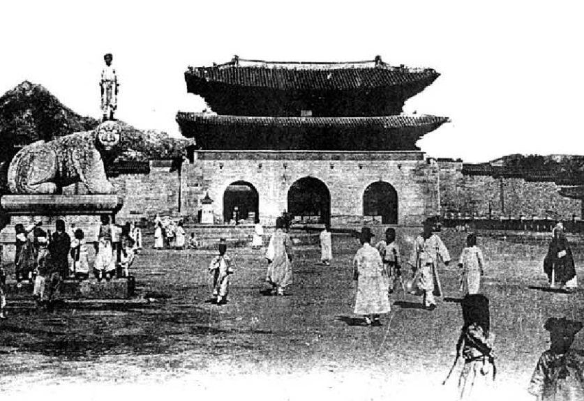
흥선대원군에 의해 재축(1867년)된 세 번째 광화문