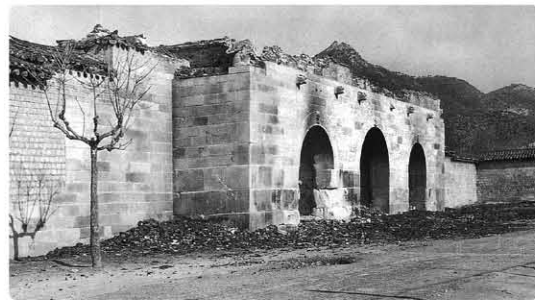
한국전쟁 당시 폭격으로 파괴된 세 번째 광화문(1951년)