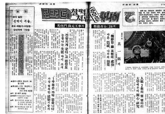
1천 년의 수명이 언급된 현장소장 인터뷰 기사(1968년)