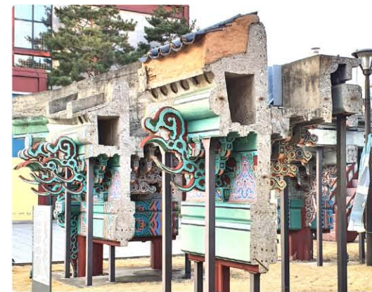
철거(2006년)된 네 번째 광화문의 부재(서울역사박물관)

대표하고, 서울시민이 가장 사랑하는 곳이라 할 수 있겠다. 게다가 경복궁은 서울의 역사와 600년 정도 함께했다. 조선시대부터 육조거리로 정치적 상징성이 컸던 경복궁의 전면 공간은 대한민국 국가 상징가로의 시작으로 서울의 도시구조에서 가장 중요한 부분을 차지한다. 월드컵 거리응원부터 시작해서 다양하고 중요한 사건들의 무대였다. 연간 150여 개 크고 작은 행사까지 꾸준히 열리는 곳이니 객관적으로도 경복궁과 국가상징가로의인 세종대로는 서울을 대표하는 상징공간임을 부정하기 어렵겠다. 이런 의미 있는 장소에서 600여 년간 중심점 역할을 해왔던 건축물이 있다. 때론 폐허가 되기도 했지만, 수차례 재축된 경복궁의 정문, 바로 광화문이다.