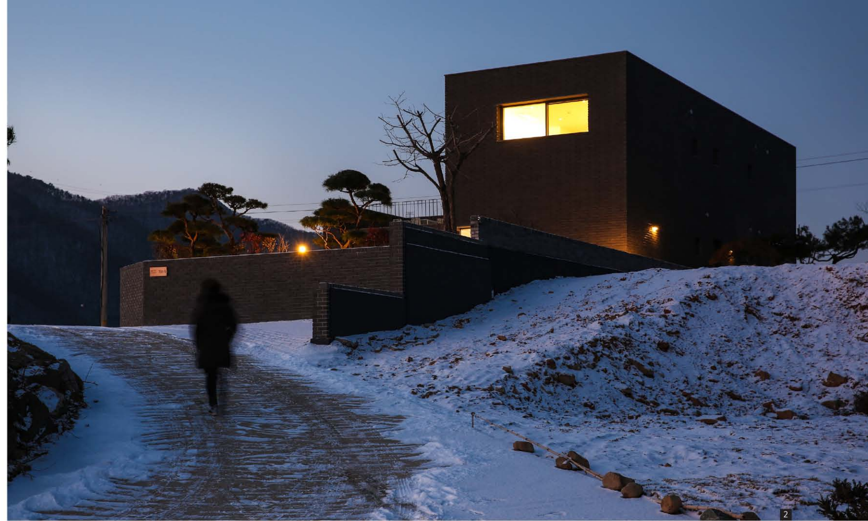
1. 전경 2. 도로 전경 3. 창호 4. 주방 및 거실 5, 6. 계단실 7. 1층 테라스

한옥의 지붕인 '기와'가 검은 색인 것은 자연에 겸허히 자리하기 위함인데, 건축이 무채색과 기하학적인 순결함을 유지하는 것은 4계절 다양하고 풍요로운 모습을 드러내는 자연을 위한 겸허의 자세라고 생각한다. 이를 위해서 주된 재료로서 장방형 벽돌과 석재를 사용하였으며, 금속을 최소화했다. 창대와 인방을 전부 석재로 시공하였고, 자재들의 분할과 이음, 연장선들을 맞추기 위해 노력했다. 조경과 인테리어, 전체적인 가구까지 모두 건축주와 호흡하며, LKSA가 설계하고 제작했다. 본 건축이 오랜 시간 동안 대지에 조금씩 더 진하게 물들어 지역 풍경의 한 요소가 되고, 한 가족의 대를 이은 행복의 기억들이 농밀하게 스며들어가기를 바래본다.