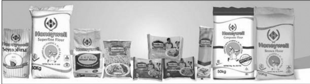
[사진 1] '나이지리아산(Made-In-Nigeria)' 포장된 식품