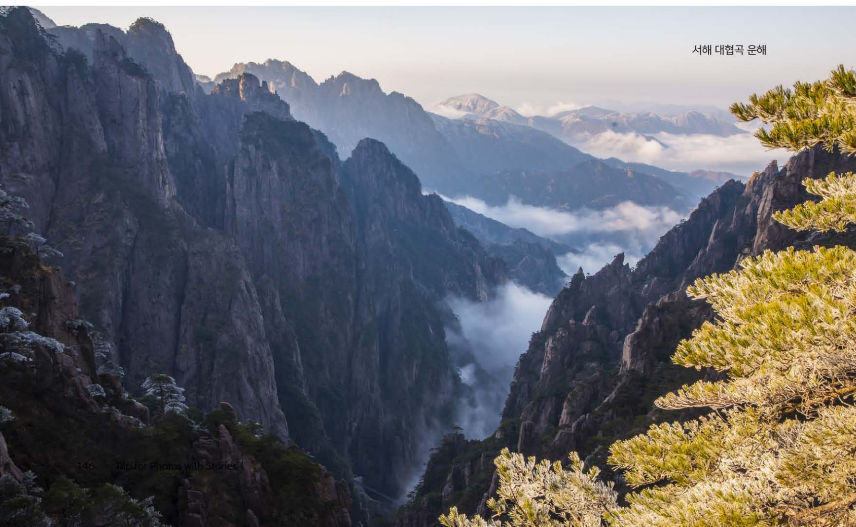
서해 대협곡 운해