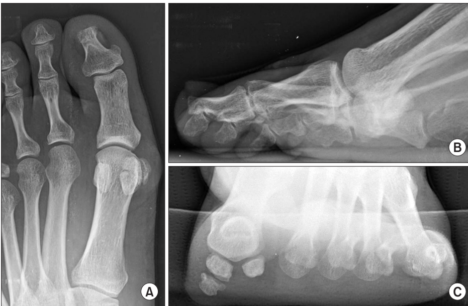
Figure 2. Preoperative weight-bearing anteroposterior (A) and lateral (B) radiographs present the bony mass lesion under medial sesamoid. (C) On sesamoid axial image, bony mass lesion is more markedly observed.

수술 후 2주간은 단하지 부목고정 및 뒤꿈치를 이용한 부분 체중 부하만 허용하였고 수술 2주차에 봉합사를 제거한 뒤부터 체중부하를 허용하였다. 수술 후 6개월까지 외래에서 추시하였으며 수술부위를