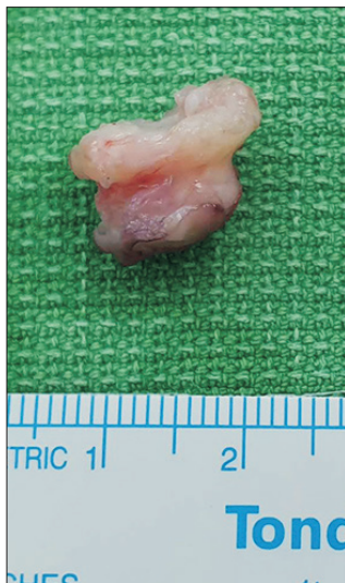
Figure 4. A 10×9×6 mm 3 sized oval bony mass was excised.

본 증례와 유사하게 족무지 내측종자골 주위에 종괴가 발견되는 경우 전술한 종양들 이외에 감별해야 할 질환으로 이분형 종자골(bipartite sesamoid)이 있다. 발생 원인과 발생률은 다양하게 보고되고 있는데 무증상인 일반인의 10%~30% 정도에서도 관찰될 수 있는 것으로 알려져 있다. 11) 이분형 종자골은 정상 종자골보다는 외상이나 골절에 취약할 수 있으며 외측종자골보다 내측종자골에서 더 흔하게 나타나는데 이는 내측종자골에 더 큰 체중부하 및 더 잦은 충격이 가해지기 때문인 것으로 생각된다. 마지막으로 감별해야 할 질환으로는 종자골의 비후(hypertrophy)가 있는데 이는 선천성 기형이나 이전의 손상 또는 족무지의 회전 변형으로 인하여 족무지 종자