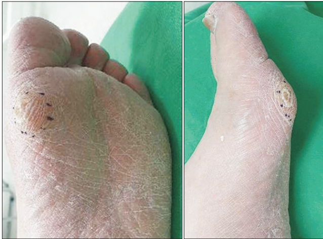
Figure 1. Clinical photographs show plantar keratosis at the plantar side of the medial sesamoid bone.

방사선 검사(sesamoid axial view)에서 병변을 더욱 명확하게 확인할 수 있었으며(Fig. 2C) 컴퓨터 단층촬영 검사상 내측종자골은 이분되어 있고 종괴는 이분된 내측종자골과는 완전히 분리되어 있는 형태로 존재하였다(Fig. 3).