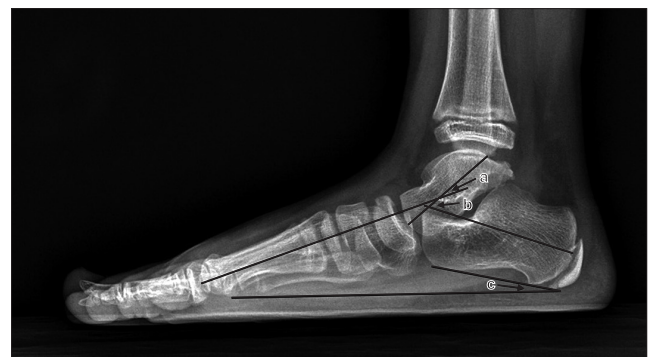
Figure 1. Radiographic parameters are shown on weight-bearing lateral radiograph. a: talo-first metatarsal angle, b: talocalcaneal angle, c: calcaneal pitch angle.

모든 환자에서 초진 시와 최종 추시 관찰 시에 족저압 검사를 시행하여 보행 시 족저압 분포를 측정하였다. 족저압 측정에는 동적 족저압 분석장치(footscan ® systems; RSscan international NV, Paal, Belgium)를 사용하였으며 1,605 mm×469 mm×18 mm 크기의 발판에 12,288개의 센서가 내장되어 있으며 족부가 족저압 판에 접촉 순간 200 Hz로 족저압을 측정하였다. 사전에 족저압을 측정할 환자와 보호자에게 측정방법에 대하여 충분히 설명을 하고 맨발로 편안한 속도로 보행하게 하여 8~12회의 동적 족저압 측정값의 평균을 사용하였다. 족저압력 분석에는 족저압 소프트웨어(v9 Scientific software; RSscan International NV)를 이용하여 분석하였으며 족부를 족지부 2구역, 전족부 5구역, 중족부, 후족부 2구역으로 나누었다. 보행 시 각 족부구역마다 가해지는 압력을 측정하여 보행 시 중족부 및 전체 족부의 단위면적당 압력(N/cm 2 )을 측정하였다. 전체 족부의 단위면적당 압력, 중족부위의 단위면적당 압력, 전체 족부에 대한 중족부위의 단위면적당 압력 분포 비율을 측정하여 실험군과 대조군을 서로 비교하였다(Fig. 2).