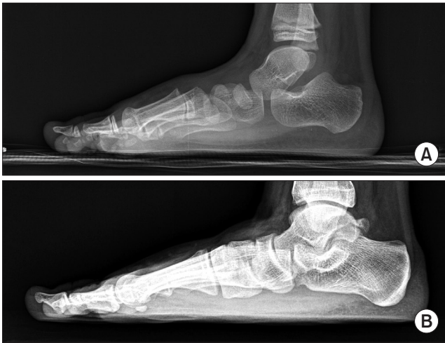
Figure 4. Initial (A) and last follow-up (B) radiograph. Radiographic parameters were improved in last follow-up radiograph. But all values were still within the abnormal range.

(Fig. 4). 다만 본 연구에서는 실험군에서 최종 추시 시 보조기를 벗은 상태에서 체중부하 방사선 검사를 시행하여 각 방사선학적 지표를 연구하였으며 이는 보조기를 착용한 직후의 일시적인 골배열 효과뿐만 아니라 장기적으로도 골배열에 영향을 줄 수도 있음을 시사한다고 생각한다.