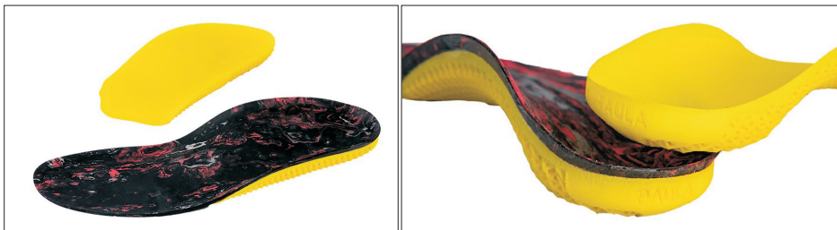
Figure 3. Three-dimensional printing insole.

초진 시 실험군 및 대조군 모두에서 동적 족저압 검사를 시행한 후 실험군은 동적 족저압 분석장치로 분석한 데이터를 기반으로 제작한 3D 프린팅 맞춤형 삽입물(Phits insole; RSprint, Beringen, Belgium)을 추시기간 동안 착용하도록 하였다. 3D 프린팅 맞춤형 삽입물은 에틸렌초산비닐(ethylene vinyl acetate)성분으로 구성되어 있으며 개개인에 맞추어 3D 프린팅기술을 통하여 제작되었다(Fig. 3). 최종 추시 관찰 시 실험군 및 대조군에서 동적 족저압 검사를 시행하였으며 실험군과 대조군 모두 맨발로 동적 족저압 측정을 시행하여 단위면적당 증축부 및 전체 족부의 압력분포를 측정하였다.