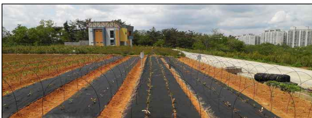
Figure 1. Weed yield by polypropylene mulching treatments(Left: 60g/m 2 overlapping, 60g/m 2 hole drilling, 80g/m 2 overlapping, 80g/m 2 hole drilling, Control)

공시수종은 산림바이오소재연구소에서 양묘된 묘고 11.7±3.0, 근원경 3.0±0.6의 증가시나무 ( Quercus glauca Thunb.) 1-2묘(3년생, 1년생 묘를 이식하여 2년 키운 묘)를 진주시 금산면에 위치한 월야 시험림에서 1m×22.5m (가로×세로) 크기의 묘상을 만들어 1처리구당 2열씩 총 92본을 식재하였으며, 시험기간은 2014년 4월부터 10월까지 (10개월간) 수행하였다(Figure 1 참조).