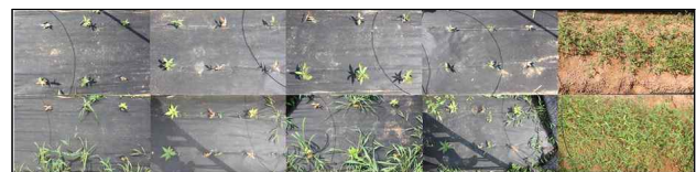
Figure 3. Growth condition of Quercus glauca Thunb. seeding by polypropylene mulching treatments(Left: 60g/m 2 overlapping, 60g/m 2 hole drilling, 80g/m 2 overlapping, 80g/m 2 hole drilling, Control, Up: April, Down: June)

품질지수 분석은 부위별 물질 생산량 값을 바탕으로 엽 건중비 (leaf dry weight ratio, LWR), 줄기 건중비 (shoot dry weight ratio, SWR), 뿌리 건중비 (root dry weight ratio, RWR)를 계