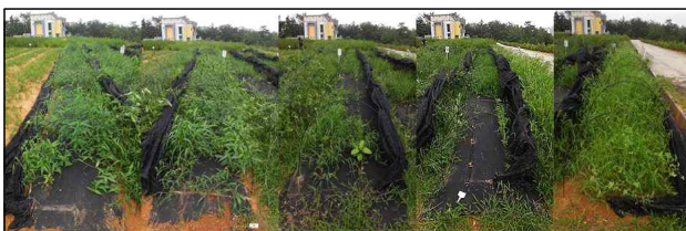
Figure 4. Weed yield by polypropylene mulching treatments(Left: 60g/m 2 overlapping, 60g/m 2 hole drilling, 80g/m 2 overlapping, 80g/m 2 hole drilling, Control)

멸칭 처리 별 식재지 조성인력과 제조작업 소요인력은 4명이 한 처리구당 줄 맞춤, 식재, 부직포 설치 시 소요되는 시간과