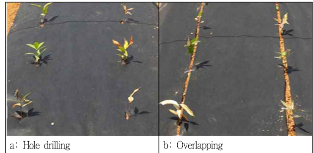
Figure 2. The polypropylene mulching method on weed treatments

대조구와 부직포 멀칭 재료 60g/m 2 , 80g/m 2 처리구의 지표