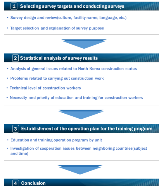
Fig. 1. Research content in this study

본 연구의 수행 과정은 북한 탈북민을 대상으로 한 설문조사를 통해 북한 건설 근로자의 의견 및 건설 공사의 문제점을 분석하고, 건설 기술 교육·훈련의 필요성과 적정 교육·훈련 프로그램 시간 및 우선순위 분석에 필요한 내용들을 조사하였다. 그리고 설문조사 결과를 분석하여 우리나라의 NCS 직무 교육·훈련 체계에서 제시하고 있는 표준과 비교하여 건설 노동자에게 적합한 급속 교육·훈련 시간을 도출하고, 교육 운영에 필요한 시설과 소요면적 등을 제시하였으며, 이들을 활용한 북한 건설기능인력의 급속 양성을 위한 교육·훈련 프로그램 운영 방향을 제시하였다.