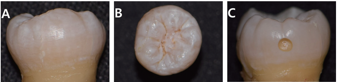
Fig. 1. (A), (B) Artificial white spot was formed on the surface of the enamel. (C) Round shaped cavity was made on a proximal surface.

를 이용하여 충분한 주수 하에 근원심면 중앙부에 각각 지름 2.0 mm, 깊이 1.5 mm 크기의 원통형 와동을 형성하였다(Fig. 1C). 각 치아 별로 형성한 와동을 무작위로 실험군과 대조군으로 나누었다. 실험군에는 와동 주변의 탈회된 치면에 infiltrant resin (Icon®, DMG, Hamburg, Germany)을 적용하였고, 대조군에는 적용하지 않았다. Infiltrant resin의 적용은 다음과 같이 이루어졌다. 치아 표면에 15% 염산겔인 Icon Etch를 2분간 적용 후 30초간 수세 및 건조하였다. 다음으로 탈수제재인 Icon dry를 30초 적용하고 건조하였다. 저점도 레진인 Icon infiltrant를 3분간 적용 후 40초 광중합하였고 1분간 재적용 후 40초 광중합하였다. 광중합기로는 multiwavelength LED인 Valo® LED Curing Light (Ultradent Products, South Jordan, UT, USA)를 사용하였으며 1000 mW/cm 2 단일 광도로 광중합을 시행하였다.