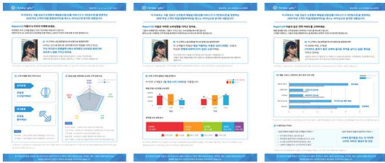
Fig. 2-1 Sample customer experience analysis report