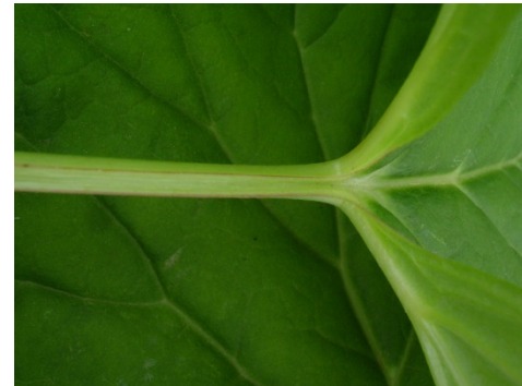
The color of petiole and petiole ear