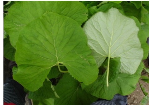
The front and back shapes of leaves