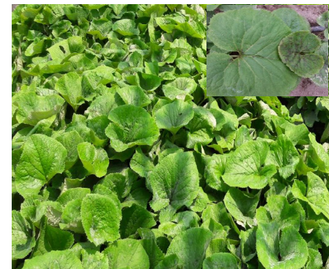
Resistance after infection to powdery mildew disease