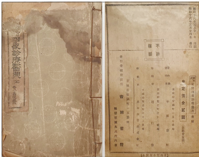
Figure 1. The picture of Donggeuisasangjinryoeuijeon(published in 1941)

저작자에 대해서 표지에는 杏林書院 編輯部라고 적혀 있으나, 서문에는 본서가 李泰浩(Fig.2)의 저작이라고 天德山人이 서문을 달아 놓았다. 1958년에