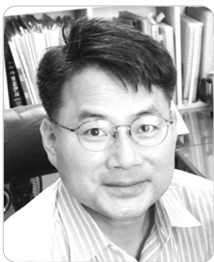
배 유 찬

최근 토종닭 계군에서 여러 종류의 면역 억제 바이러스가 감염되어 육성 후기에 큰 피해를 준 사례가 확인되어 이를 공유하고자 한다.