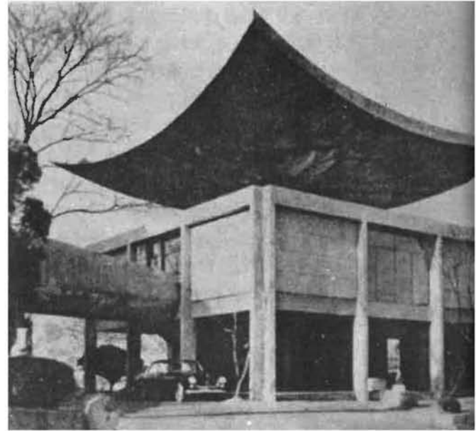
주한 프랑스대사관 <김중업 건축사 작품>

만일 자기의 작품을 스승의 정신, 기능적 원리에 의해 제작하였다면 결코 민족적인 조형의 의식으로 눈을 돌리지 않았을 것이다. 자기의 작가정신과 본질적으로 배치되는 것이기 때문이다. 그럼에도 불구하고 민족적인 조형이 성립된다면 주