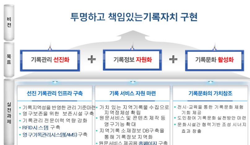
〈그림 3〉 경상남도기록원 비전(경상남도기록원 ISP 운영사업)

경상남도기록원은 경남의 공공기관에서 생산된 (생산되어야 하는) 기록을 관리하고 그것을 보다 정확·신속하게 이용할 수 있도록 하여야 하며 특히 역사적으로 보존가치 있는 기록을 평가·선별하여 후대에 길이 보존할 책임을 가지고 있다. 또한 민간기록도 함께 수집하여 경남 역사의 결락을 보완하고 보다 질적으로 우수한 기록서비스가 수행될 수 있도록 하여야 한다. 이러한 이상을 위해 경상남도기록원은 「투명하고 책임 있는 기록자치 실현」이라는 비전을 가지고 그에 따른 목표, 실천과제를 정의하였다.