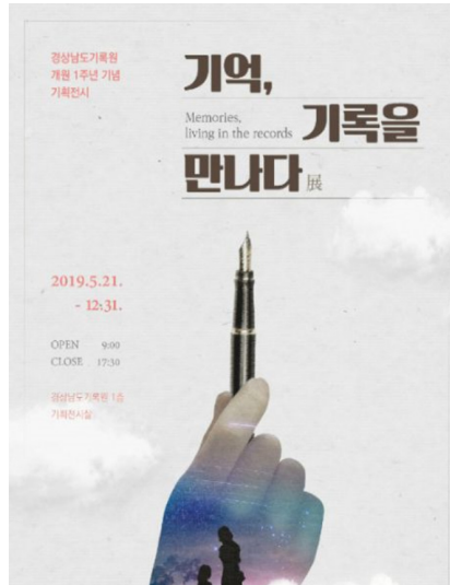
(경상남도기록원 개원 1주년 기획전시 포스터)