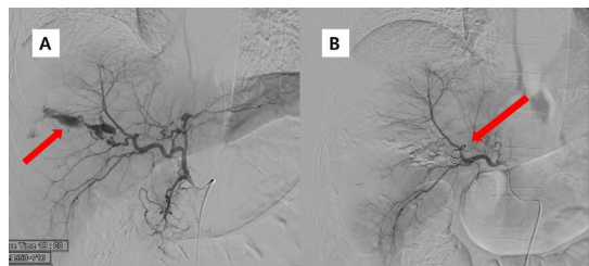
Fig. 2. Emergency angiography was done without computed tomography (CT) (A) Massive extravasation from the branch of the right hepatic artery was observed. (red arrow) (B) The coil embolization for the posterior branch of the right hepatic artery was performed. (red arrow)