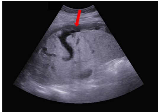
Fig. 1. Ultrasonography on arrival. The red arrow indicates fluid collection which was suspicious of blood.

혈관색전술을 시행하였다 (Fig. 2). 혈관조영술 및 색전술에 걸린 시간은 총 40분이며, 혈관색전술 직후 환자의 혈압은 120/77 mmHg로 상승하였다. 생체징후가 안정된 것을 확인한 후 색전술 종료 7분만에 전산화단층촬영을 시행하였고, 복강내 추가적인 출혈이나 장천공 등을 의심할 만한 공기 음영이 없음을 확인하였다 (Fig. 3). 환자의 최종 손상중증도점수 (Injury Severity Score, ISS)는 38점으로 중증의상에 해당하였다. 환자는 곧바로 중환자실로 입실하여 보존적 치료를 시행하였고, 일주일 후 일반병실로 전실하였으며, 입원 30일째 특별한 합병증 없이 퇴원하였다.