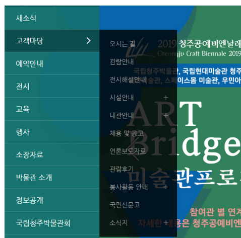
<그림 5> 고객마당의 하위메뉴