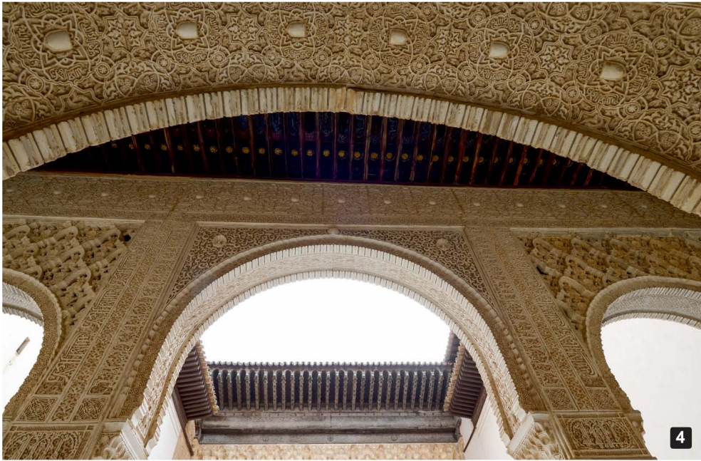
1. 알함브라 궁전의 전경 2,3. 알함브라 궁전의 반영 모습 4,5. 이슬람 건축물의 화려한 문양과 조각 6,7. 이슬람 건축물의 백미라고 할 수 있는 화려한 궁전 천정