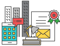
공공부문 정규직 전환 기관별 실적 공개 (2018년 8월 기준)

대한산업보건협회는 365일 국민과 함께합니다. 조금 더 건강한 사회를 위해 행동하고, 유익한 정보를 제공하여 국민 삶의 질이 향상되는 데 기여하기 위해 노력하고 있습니다.