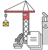
2019년 소규모 건설현장 추락방지시설 설치지원 대폭 확대

기관별 구체적인 전환실적은 “공공부문 비정규직 고용개선 시스템( http://public.moel.go.kr )” 자료실에서 확인할 수 있다.