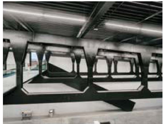
그림 6) 내부 작업공간의 점차 높아지는 구조를 만들기 위해 특별 제작된 트러스

건물의 높이가 낮은 곳(4.5m)에서 높은 곳(13m)로 점차 높아지는 구조를 가지고 북쪽 매스의 작업공간-Free space-을 만들기 위해 구조적으로 천정 쪽에 길이가 약 45m에 달하는 11개의 트러스가 필요했다. 이 트러스 구조는 무거운 스틸을 레이어로 절단하는 방법으로 제작됐다.