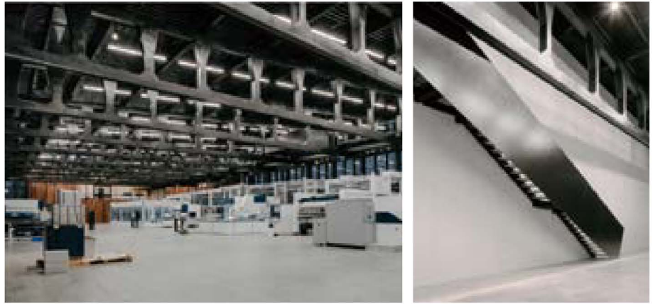
그림10) 건축물에 쓰인 내장재는 검은색 계열의 목재로 마감. 계단의 난간의 검은색 철판을 이용해 처리 했다.

건물의 내장재는 외장재로 쓰여진 차가운 메탈이나 산업적 재료와는 달리 따뜻한 느낌의 검은색 계열의 목재를 벽체 마감으로 사용하고, 바닥은 콘크리트 폴리싱 후 하드너로 처리했다. 간간히 보이는 계단의 난간이나 가구요소들은 철판 한판으로 처리한 것이 노출된 구조체와 꽤 잘 어울린다.