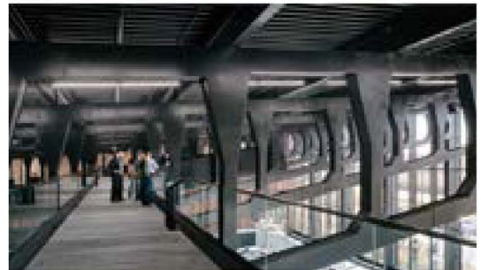
그림 7) 천장 구조물을 관통하는 다리인 스카이 워크

재미있는 부분은 관람객이 천장 구조물을 관통하는 다리인 스카이 워크-Sky walk-를 통해 건물에 대해 새로운 공간을 만나고 구조물이 구조의 역할을 넘어 공간의 일부로서의 역할을 하도록 한 것이다. 물론 이러한 천정에서 내려다보는 전시 공간 및 작업용 공간은 굉장