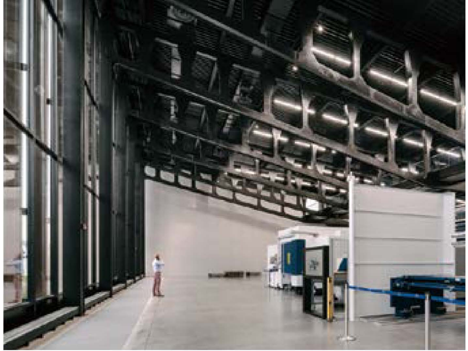
그림 5) 트럼프 스마트 팩토리의 내부 작업공간

건물의 높이가 낮은 곳(4.5m)에서 높은 곳(13m)로 점차 높아지는 구조를 가지고 북쪽 매스의 작업공간-Free space-을 만들기 위해 구조적으로 천정 쪽에 길이가 약 45m에 달하는 11개의 트러스가 필요했다. 이 트러스 구조는 무거운 스틸을 레이어로 절단하는 방법으로 제작됐다.