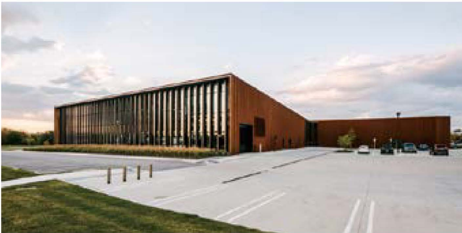
그림 1) 트럼프 스마트 팩토리(시카고, 미국) 외관

글. 이지현 Lee, Jihyun jihyun.lee815@gmail.com