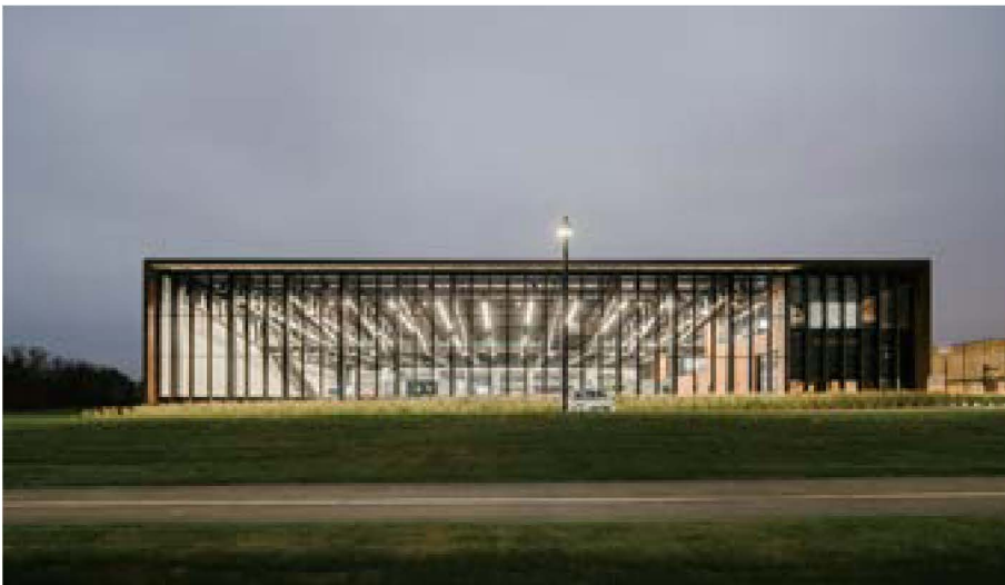
그림 9) 남쪽의 13m 커튼월 파사드. 도로 쪽으로 향해 있어 기업 홍보의 역할도 한다.

월은 천장부터 바닥까지 13m에 해당하는 길이를 유리의 제작 및 생산, 운반, 시공 과정을 고려해 세 판으로 나누어 설치했다. 커튼월의 모듈과 구조체의 모듈이 하나를 건너뛰면서 일치하도록 해 안쪽에서 보았을 때는 멀리언 두께의 리듬감이 생긴다.