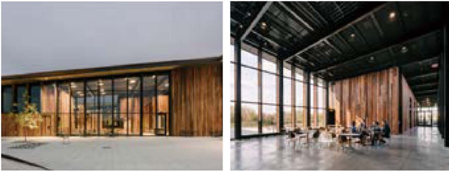
그림 3) 지붕선이나 천장고가 부드럽게 사선으로 이어지면서 내부 공간들을 연결 시켜준다.

주문에서 설계, 제조 및 납품에 이르기까지 전체 생산 과정을 보여주는 디지털 네트워크 기계설비도 역시 남쪽 매스에 위치되어 있다. 이는 단순한 공간적 필요 때문인데, 사무실 및 카페 등의 친밀감을 요하는 곳은 천정고가 낮아도 되지만 전시공간이나 공장기기를 담는 공간은 높은 천정고를 필요로 했기 때문에 매스의 끝을 높게 시작해 점점 내려가면서 북쪽에는 가장 낮은 지대를 둔 것이다. 지붕선이 사선으로 부드럽게 이어지면서 건축물 전체를 하나로 통일, 연결하는 것 처럼 보이도록 했다(그림 3). 두 개의 직사각형 매스는 모서리 부분에서 연결되고 접합부에서 실외공간인 휴식공간을 제공한다.