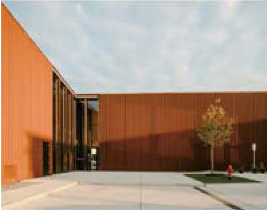
그림 8) 코르텐 스틸로 마감된 외관

히 극적인 전망-View-을 제공한다. 다른 한편으로 최대 13m에 달하는 건물의 남쪽(그림 9)은 앞의 고속도로로 향하면서 의도적인 기업 홍보 효과를 누리기도 한다.