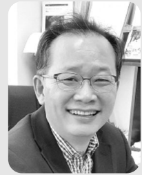
문 홍 길