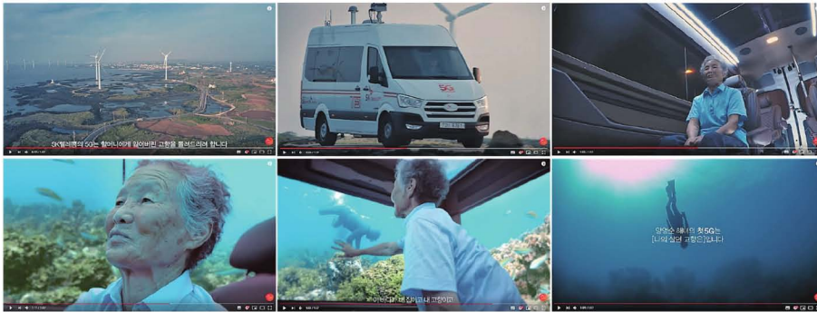
SK텔레콤_TVCM_어느 해녀의 그리움 편_2017_스토리보드 ②