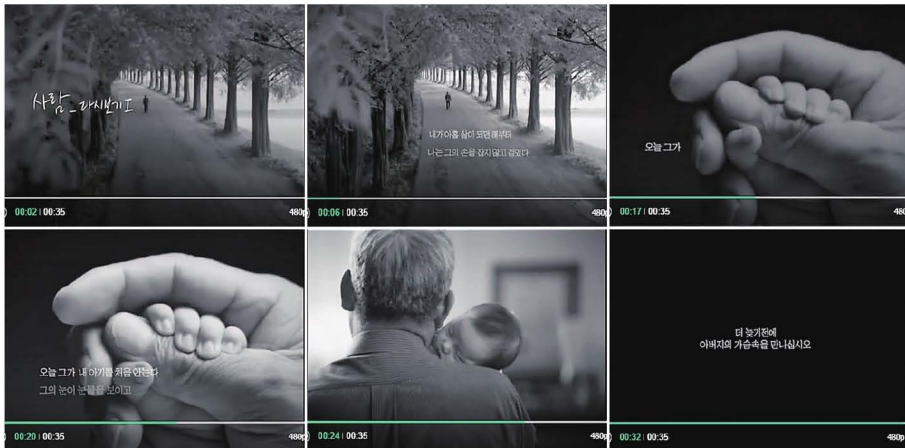
SK텔레콤_TVCM_ 사람 다시보기/아버지 편_2008_스토리보드

자막) 사람_다시보기 I 아들 O.V) 내가 아홉 살이 되던 해부터 나는 그의 손을 잡지 않고 걸었다. 그는 마음을 표현하는 법을 몰랐고 나는 그가 궁금하지 않았다. 오늘 그가 내 아기를 처음 안는다. 눈물을 보이고 자장가를 부른다. 나는 과연 당신에 대해 무엇을 알고 있었던 걸까? 자막) 더 늦기 전에 아버지의 가슴 속을 만나십시오. MBC캠페인 이 캠페인은 SK텔레콤이 함께 합니다.