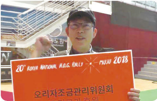
“환절기 감기 오리고기 먹고 다 없앨 겁니다!! 좋은 날 우리 오리고기 파이팅!!”