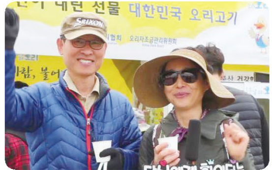
“(오리고기가) 느끼하지도 않고요, 담백해서 먹기 좋아요! 우리나라 우리 오리 파이팅!!”