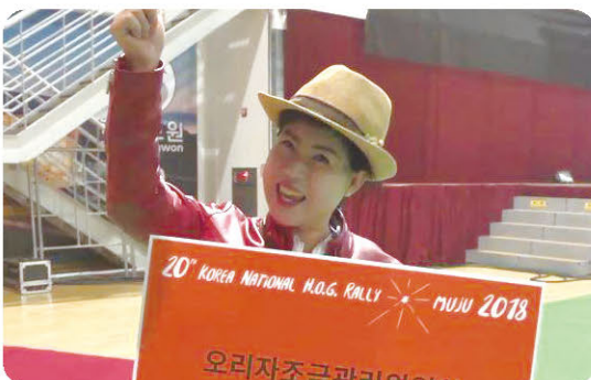
“면역력 기르는 데 오리고가 최고라고 들었습니다~! 좋은 날 우리 오리고기 파이팅!!”