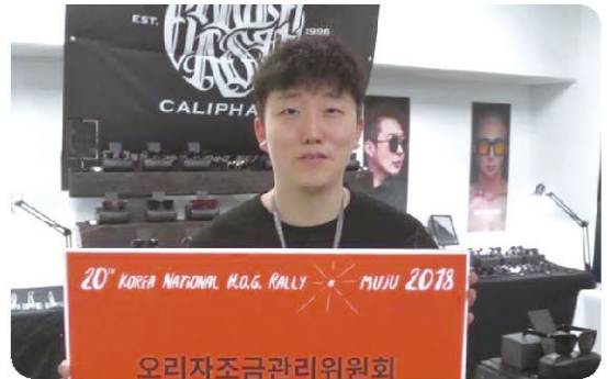
“오리가 새 중에 갑(甲)이잖아요~ 오리고기 많이 먹고 저도 건강 갑(甲)될거예요! 좋은 날 우리 오리 파이팅!”