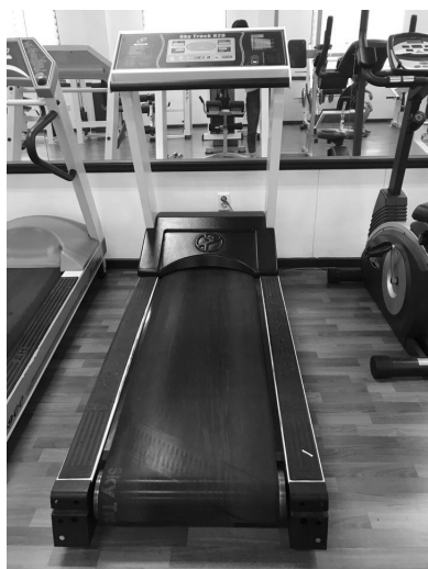
그림 1. SKY Track 820, Yo-Life, Russia