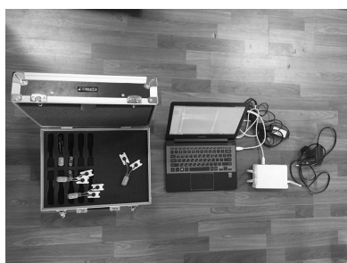
그림 2. wave plus EMG, cometa, Italy