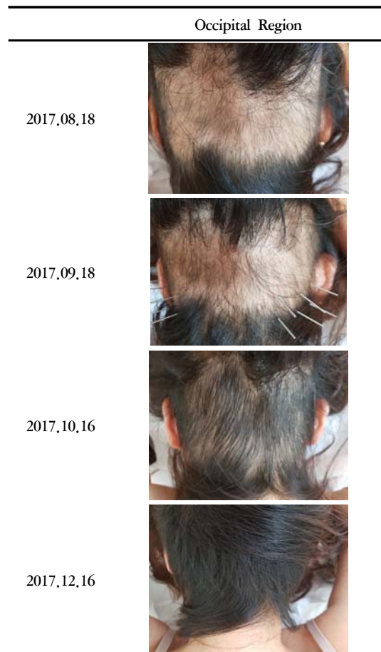
Fig. 3. Progress of Case 2