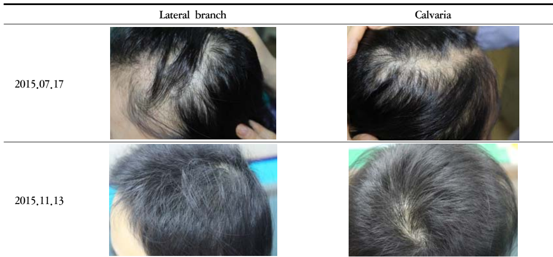
Fig. 1. Progress of Case 1