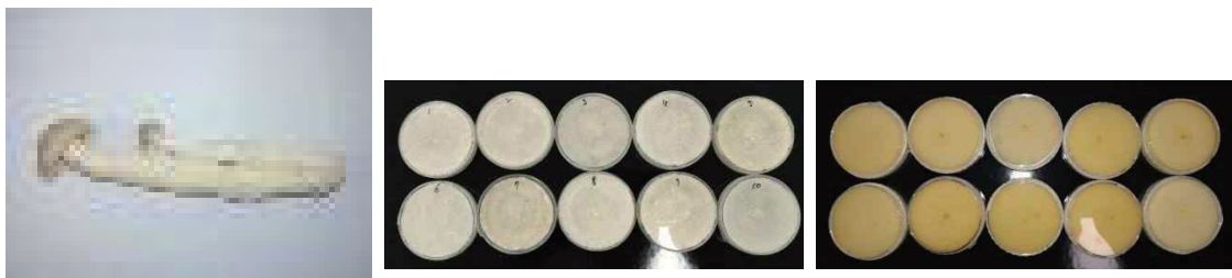
Fig. 1. Haesongii fruiting body and mycelial growth appearance for tissue culture

미리 살균된 에펜도르프튜브(Eppendorf-Tube)를 6개를 준비하여 각 10-1~10-6까지 표기한 뒤 멸균수 1000, 900μℓ씩 넣었다. 1번 튜브에서 100 Micro Pipette을 이용하여 100μℓ를 뽑아서 미리 받아 포자가 있는 Petri-dish에 포자가 있는 부분에 뽑고 5-6회 펌핑을 해주어 그것을 다시 1번