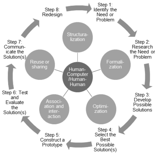
(Fig. 1) Model of Learning Computational Thinking

력 학습 모델에는 컴퓨팅사고력의 정의, 컴퓨팅사고력의 핵심 내용 그리고 컴퓨팅사고력 학습의 문제 해결 방법이 포함된다. 이 모델에서 컴퓨팅사고력의 핵심 요소는 구조화, 형식화, 최적화, 연관성 및 상호 작용, 재사용 또는 공유의 다섯 가지로 정리한다. 이 컴퓨팅사고력 모델의 안쪽에 원을 구성하고 있으며, 중심을 축으로 회전할 수 있다. 이 회전하는 컴퓨팅사고력은 학습과정에서 고정된 순서 없이 동적으로 사용할 수 있다.