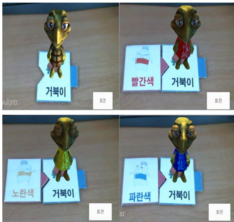
그림 5. 형용사 단어 카드를 조합하여 렌더링된 모델의 색상 조절

이를 구현하는 방식은 앞서 설명한 것처럼 마커 사이의 거리 측정을 기반으로 하기 때문에 동사를 조합할 때와 유사하다. 다만, 애니메이션 모델을 출력하는 방식에서 동사의 경우에 Bool함수를 사용하였다면 형용사는 모델의 크기나 텍스처를 바꾸는 함수를 활용하였다. 우선, 크기 변화의 경우, 거리조건이 만족되었을 때 ‘큰’ 카드의 경우 모델 스