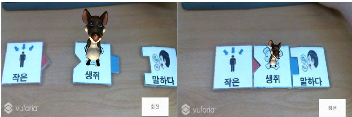
그림 6. 조각맞추기 퍼즐처럼 제작된 마커