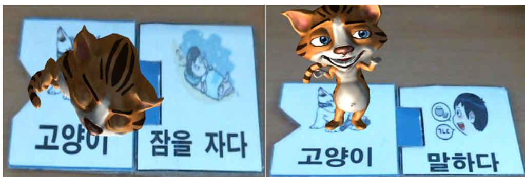
그림 3. 동사 단어 카드와 명사 단어 카드 조합 Fig. 3. Combination of verb word cards and noun word cards