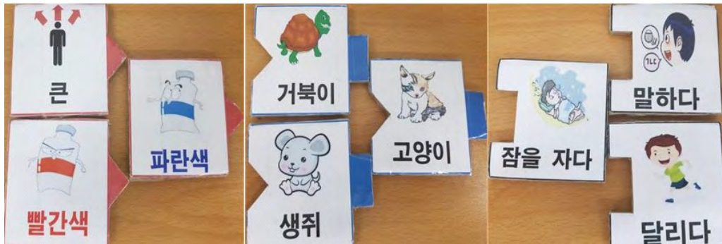
그림 2. 제안된 어플리케이션에서 사용된 형용사, 명사, 동사 단어 카드 마커의 예 Fig. 2. Examples of word markers (for adjective, noun, verb) used in the proposed application

유아들은 표상활동을 통해 이야기를 보다 깊이 이해 할 수 있고 표현에 대해 더욱 흥미를 느끼게 된다. 보고, 듣고, 읽고 느낄 수 있는 다양한 감각을 동시에 활용하여 학습하는 것은 학습자의 흥미를 유발시키고 학습을 즐겁게 하는 효과가 있다 7) . 앞서 말한 바와 같이, 유아에게 단어와 함께 그림을 같이 제시하는 것이 유아의 어휘력 증가에 도움을 주기 때문에 단어 의미 및 문장 구조 교육에 낱말 카드와 애니메이션을 이용한 시각적 효과를 사용하였다. 유아의 흥미를 끌만한 캐릭터를 이용해 동물 단어카드를 카메라에 비추었을 때 단어 카드 위에 가상 개체(3차원 그래픽 모델)가 나타나고 동물 모델이 렌더링된 상태에서 동작(동사)을 나타내는 단어 카드를 가까이 가져가면 가상 개체는 동작 단어카드에 해당하는 애니메이션으로 바뀌어 동물의 움직임 시각적으로 보여준다(그림 3 참조).