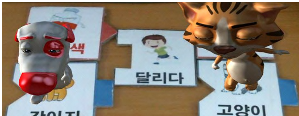
그림 8. 다수의 모델이 같은 동작 수행하도록 구성 Fig. 8. Making multiple models do the same action

마커 위의 객체가 렌더링 될 때 출력되는 모델은 마커를 기준으로 정면을 바라보고 서 있게 된다. 그러나 일반적으로 비스듬한 각도에서 마커를 관찰하는 경우가 대부분이기 때문에 비스듬한 각도에서 카메라를 들고 있을 때 모델의 모습이 잘 보일 수 있도록 모델의 x축을 중심으로 -20°정도 회전하여 정면이 잘 보이면서도 자연스럽게 서있게 표현해 주었다. 그림 9는 잘 보이도록 조정된 모델과 조정하지 않