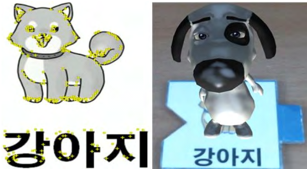
그림 1. Vuforia SDK를 사용한 마카기반 증강현실 Fig. 1. Marker-based augment reality using Vuforia SDK

기본적인 단어의 의미와 문장 구성의 원리에 대한 교육 효과를 얻기 위해서 마커는 명사, 동사, 형용사 단어카드를 제작하여 사용한다(그림 2 참조).