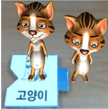
그림 9. 관찰을 용이하게 하기 위해 렌더링된 모델을 x축에 대해 회전 Fig. 9. Rotating the rendered model around the x-axis for a better view

그림 10은 스마트폰과 태블릿을 이용해서 구현된 어플리케이션을 사용하는 모습을 보여준다. 구현된 기능은 잘 실행됨을 확인할 수 있었으나, 실제 모바일 기기 환경에서 유아들이 어플리케이션을 이용하여 언어 학습을 하는 시나리오를 가정해 보았을 때 기기를 들고 유아 혼자서 단어 카드를 이용한 문장 구성, 화면 터치, 카메라 방향 전환을 통한 시점 조정 등의 조작을 하는 것은 어려울 수도 있다는 결론을 내렸다. 이를 해결하기 위해서 추후에 스마트폰 화면을 TV나 모니터로 연결하는 방식이나 혹은 모바일 기기를 고정할 수 있는 거치대 등을 도입하는 방식이 필요할 것으로 판단된다.