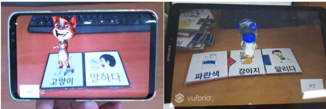
그림 10. 스마트폰과 태블릿에서 어플리케이션 실행 및 기능 확인 Fig. 10. Running our application on a smart phone and a tablet and testing its functionalities

앞서 실험 결과에서 언급한 내용 이외에 추후, 어플리케이션의 언어 교육 기능을 개선하기 위해 단어 조합의 수