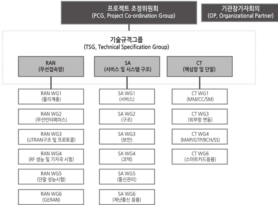
[그림 1] 3GPP 표준화 조직