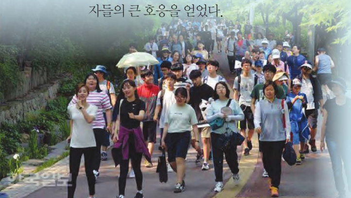
남산 둘레길을 걷고 있는 참가자들