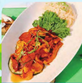
오리고기 초무침과 냉소면