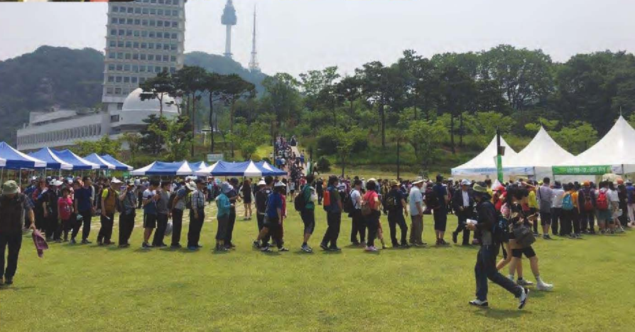
오리고기 시식을 위해 행사장 가득 줄을 선 참가자들