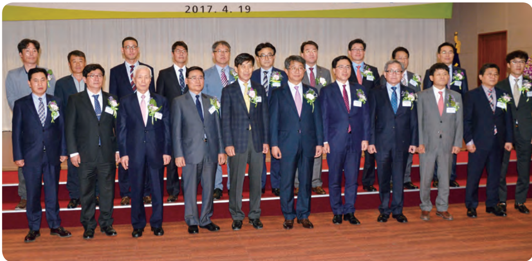
시상식 후 기계설비를 비롯한 우수 전문건설 시공업체 기념촬영

박상우 LH 사장은 “건설경기 침체 등 대내외 어려운 여건 속에서도 시공품질 향상을 위해 각고의 노력을 기울여 주신 수상업체에 감사드린다”며 “일회성 이벤트에 그치지 않고 LH와 민간업체 간 상생협력으로 주택·단지 품질이 한 단계 향상되는 계기가 되길 바란다”고 밝혔다.