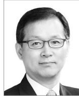
▲ 장기윤 원장

축산물안전관리인증원과 식품안전관리인증원으로 이원화하여 인증·관리되어오던 HACCP이 하나의 기관으로 통합된 한국식품안전관리인증원(원장 장기윤, 이하 식품안전인증원)이 지난 13일 공식 출범했다. 새로이 출범한 식품안전인증원의 초대 원장에는 장기윤 전 식품의약품안전처 차장이 취임했다. 신임 장 원장은 서울대학교 수의학과를 졸업했으며 식품의약품안전처 차장, 농림수산물검역검사본부 동식물위생연구부장, 농림수산물부 검역정책과장 등을 역임한바 있다. 한편, 식품안전인증원의 조직은 본원과 6개 지원, 2개 출장소로 운영되며 본원은 충북 청주시 오송읍에 위치한다.