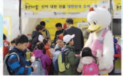
▲ 어린이들에게 인기 만점 '한국오리협회 캐릭터 아리'