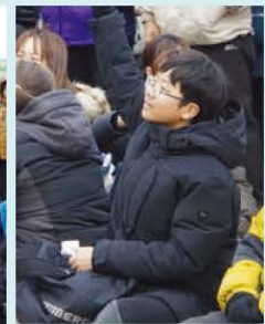
오리 퀴즈 이벤트