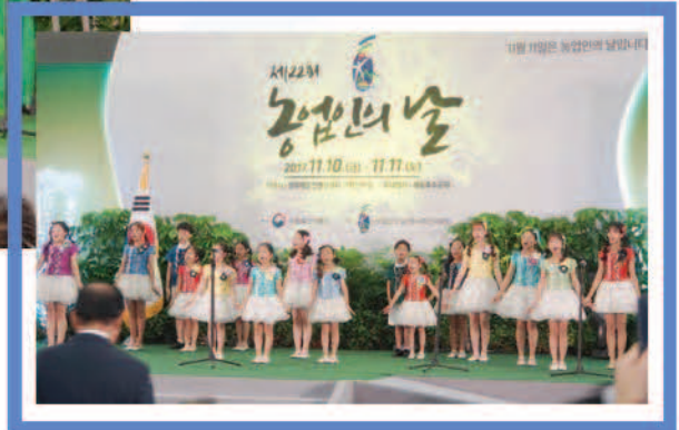
▲ 어린이합창단의 주제곡 합창 공연