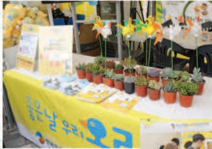
◀ 한국오리협회 · 오리자 조금관리위원회 홍보부스