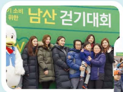
▲ 미스코리아와 포토타임 ▶ 남산 걷기대회 출발 전 준비운동