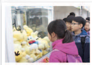
▲ 오리인형뽑기 이벤트