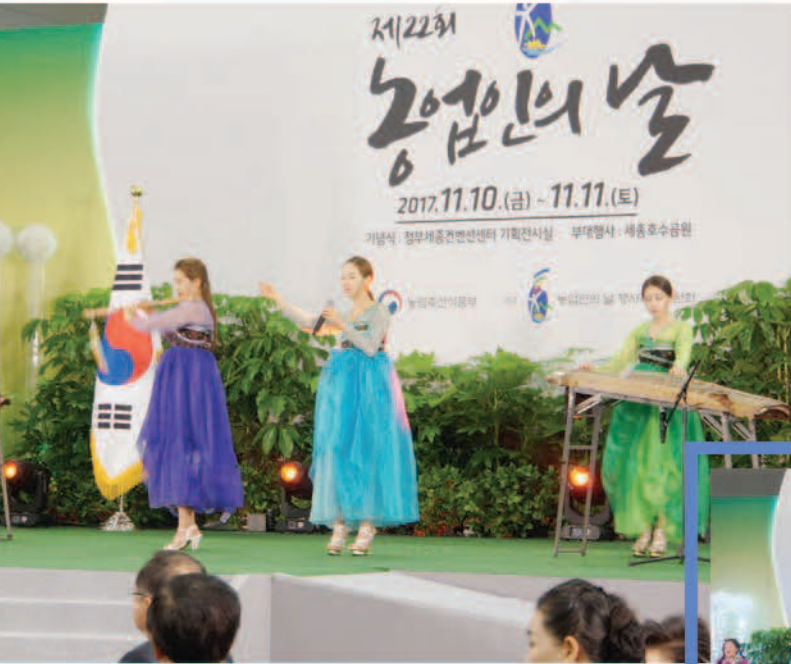
▲ 퓨전국악(플라워) 기념식전 공연