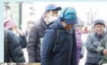
주사위5·2 던지기 이벤트