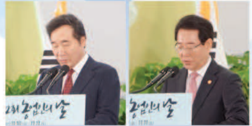
〈격려사〉 이낙연 국무총리

흙 토(土)자를 나누면 십(十)과 일(一)이 되는 점에 착안, 1964년 농사개량구락부 원성군 연합회가 11월 11일 · 농민의 날 · 행사를 최초 개최