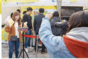
▲ 오리고기를 맛있게 먹고 인터뷰 중인 시민