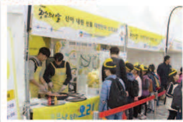
▶▼ 오리고기를 시식하기 위 해 줄서있는 시민·어린이들