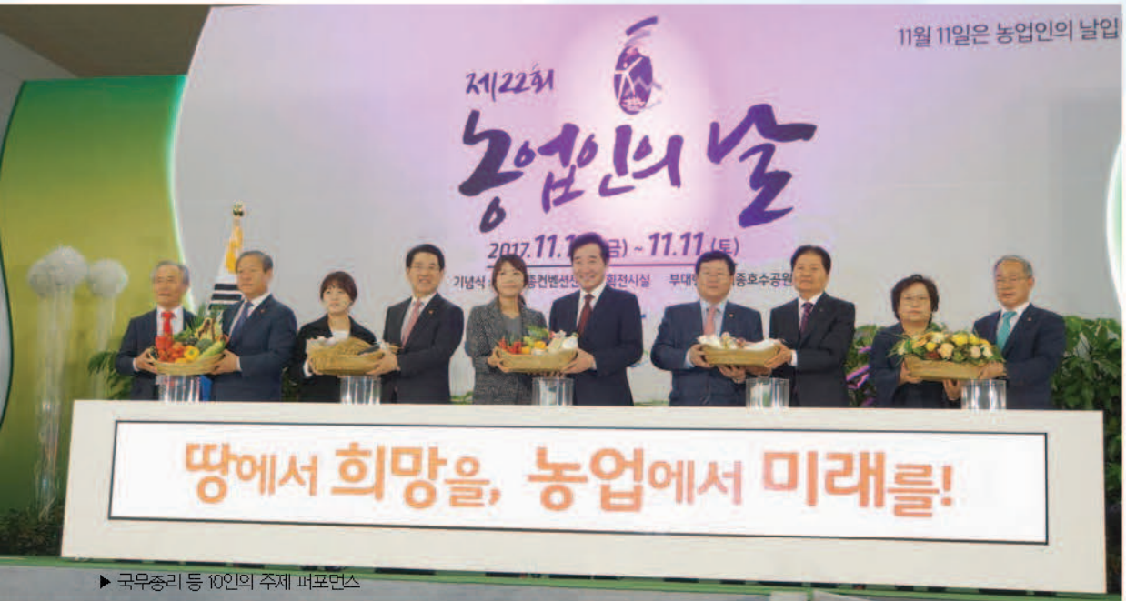
▶ 국무총리 등 10인의 주제 퍼포먼스

제22회 농업인의 날을 맞아 '땅에서 희망을, 농업에서 미래를!'이라는 주제로 11월 10일(금)~11(토) 이틀간 농업인과 국민이 함께하는 화합의 장이 열렸다.