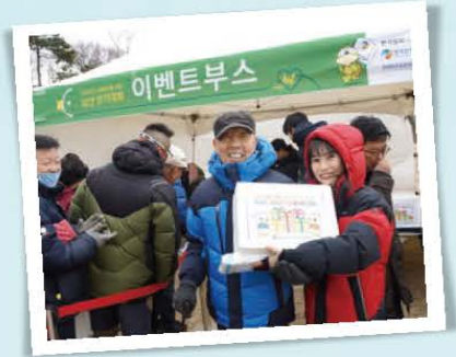
▲▼오리고기 선물세트 경품에 당첨된 참가자들