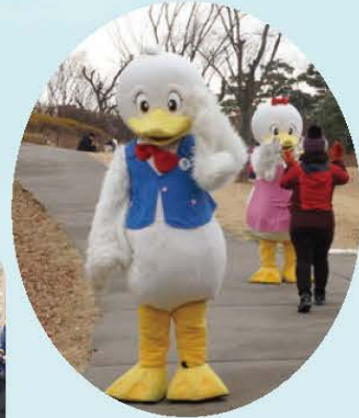
걷기 대회 마친 참가자들을 반기는 코리 아리