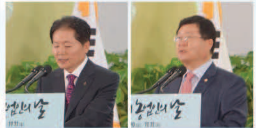
〈환영사〉 김병원 농업중앙회장