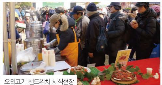
오리고기 샌드위치 시식현장