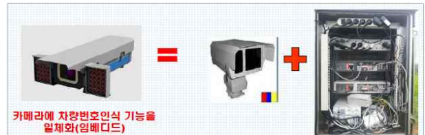
그림 1. 시스템 단순화

본 논문에서 사용한 시스템은 그림1 과 같이 합체, UPS, 내장장치가 별도로 필요가 없으며, 비용절감 효과가 높고, 이미지 파일 기반 연동과 기존 시스템 연동이 용이하다.