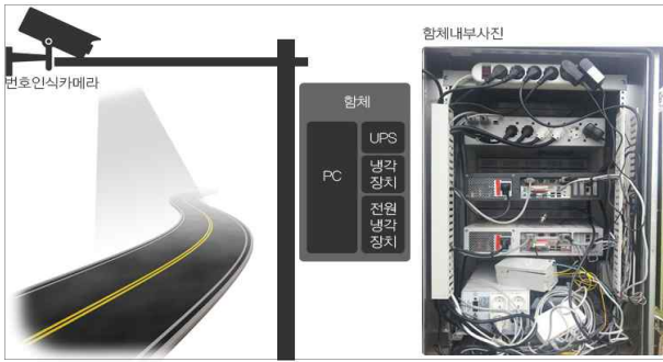
(a) PC Sytsem