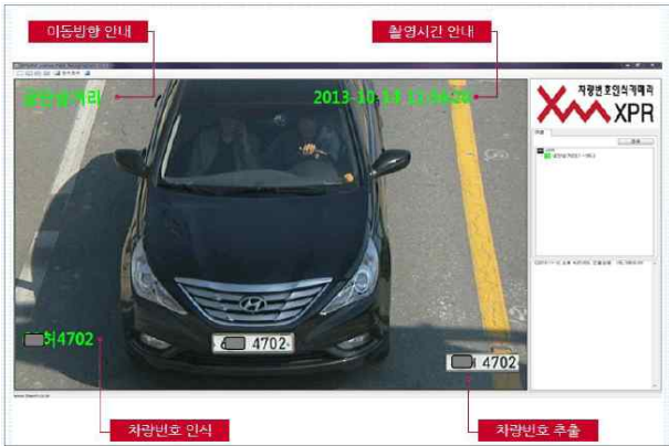
그림 3. 차량번호 인식