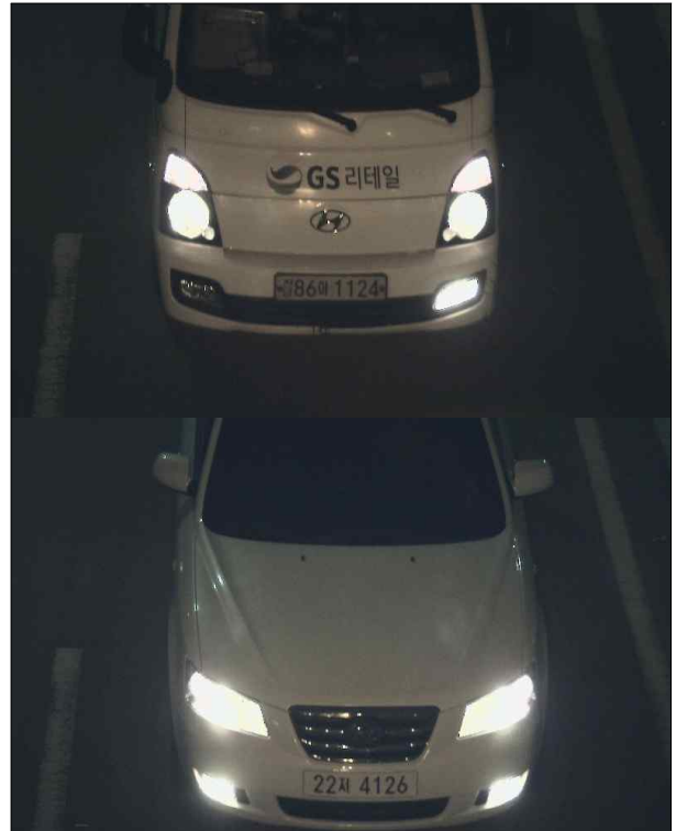
그림 6. 카메라 노출 후 야간 이미지