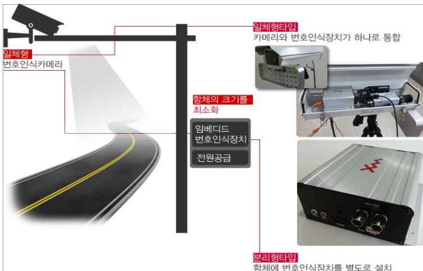
(b) 임베디드 시스템