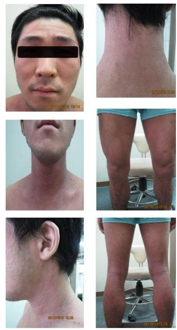
Fig 3. 2015.10.26.