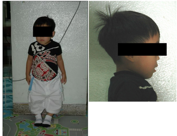
Fig. 1. Initial extra-oral photograph at 2 years and 1 month old. The height was less when compared with average it of age-matched child. There were frontal bossing, depressed nasal bridge and bowed legs.

환아가 4세 9개월이 되었을 때 촬영한 파노라마 사진을 통하여, 질환의 특징적인 치아 소견 중 하나인 상아법랑경계까지 확장된 치수각과 발달된 협측구를 미맹출 하악 제1