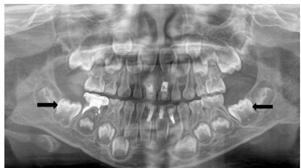
Fig. 3. Panoramic radiograph at 4 years and 9 months old, showing large pulp chambers and extended pulp horns affecting both primary and permanent molars(arrow).

대구치에서도 확인 할 수 있었다(Fig. 3). 환아는 3 - 6개월 간격으로 본과에 내원하였고, 그 기간 동안 상악 좌측 측절치와 제1유구치, 하악 좌측 제1, 2유구치의 우식, 외상 등의 외부적인 원인 없는 치아농양의 발생으로 치수절제술을 시행하였다. 7세 4개월에 촬영한 파노라마 사진에서 해