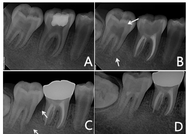
Fig. 6. (A) Periapical view at 12 years and 9 months old. Mandibular right first molar was showed periradicular radiolucency and performed endodontic treatment.(B) At 13 years and 6 months old, although no dental decay was obvious, mandibular right second molar showed periradicular radiolucency and prominent mesial pulp horn(Arrow). (C) At 14 years and 4 months old, mandibular right second molar showed dentoalveolar abscess(Arrow). (D) Radiograph taken at the 9 months following up revealing that mesial marginal bone loss healing was in progress.

X 염색체 우성 저인산혈증성 구루병(X-linked dominant hypophosphataemic rickets, XLHR)은 PHEX (phosphate regulating gene with endopeptidase activity on the X chromosome) 유전자의 돌연변이에 의한 X 염색체 우성유전 형질을 나타내는 것으로 알려져 있으며, 최근에 상염색체 열성유전의 경우도 보고되고 있다 11,12) . PHEX gene 돌연변이에 의해 신장 근위세뇨관에서 인산 재흡수의 감소가 발생하는 것으로 알려져 있으며, 또한 이 유전자는 막성 펩타이드 내부 분해 효소의 합성에 관여하는 것으로 알려져 있다. 흔히 X 염색체 우성유전 형질이기에 때문에 남성이 여성보다 더 심하게 이환 되는데 저인산혈증이 우선 나타나고 이로 인한 이차적인 증상으로 구루병이 발생한다고 알려져 있다 2,13,14) .