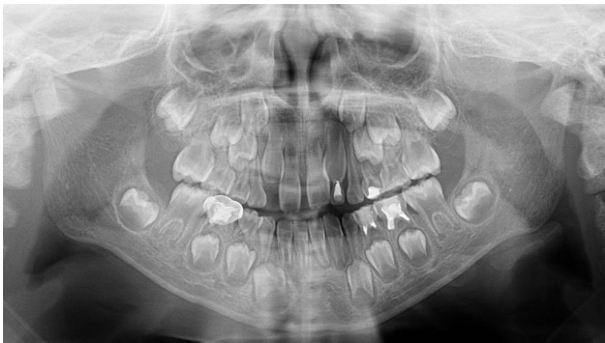
Fig. 4. Panoramic radiograph at 7 years and 4 months old showing radiolucency under treated primary left molars. But, normal mixed dentition was revealed without complications such as early tooth loss, space and eruption problems, etc.

환아의 나이가 12세 7개월이 되었을 때 시행된 정기검진에서 치면열구전색의 탈락이나 우식 및 치아농양 등의 질환이 발견되지 않았으나 2개월 뒤 하악 우측 제1대구치의 치