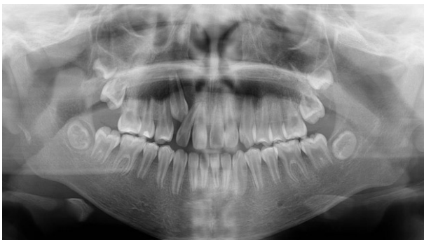
Fig. 5. Panoramic radiograph at 11 years and 7 months old showing normal exchange to permanent dentition, but showing large pulp chambers, incomplete root formation and prominent pulp horns extending up to the dentinoenamel junction.

아농양의 발생하여 치수절제술을 시행하였다(Fig. 6A). 하악 우측 제1대구치의 근관치료 및 전장관수복을 완료 한 후 정기검진을 시행하는 중에 다시 하악 제2대구치의 치아-치조농양이 발생하였다(Fig. 6B, 6C). 미완성 치근관 상태이기 때문에 재혈관화를 시행하였고, 8개월 후 증상의 소실 및 골 소실부위의 치유가 진행됨을 확인하였다(Fig. 6D). 6개월동안 증상을 더 관찰 한 후에 해당치아도 전장관수복 계획 중이다.