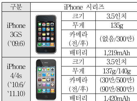
<표 2-1> 애플社 iPhone 시리즈 하드웨어

하드웨어적인 측면 이외에도 각 사에서는 방수방진, 손떨림 보정기술(OIS), 지문인식, 홍채인식, 조리개 값, 디스플레이, 플래시, 슬로우 모션, 4K 영상 촬영 등의 다양한 신기술을 내놓았고 이들은 수치가 아닌 광고를 통해 소비자에게 많이 알려졌다.