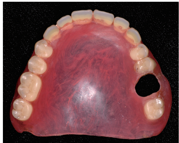
Fig. 2. Flexible denture of 1 st visit.

환자는 10여 년 전에 상악 탄성의치와 하악 국소의치를 제작하였고 장착 초기에는 큰 불편함이 없었다고 했다. 그러나 시간이 지나면서 저작 시마다 상악 탄성의치의 움직임이 문제가 되었고 구개부의 통증이 발생하였다. 안정성이 결여된 상태의 의치를 오랜 기간 장착하면서 상악 구개부의 골노출 병소가 점점 커졌지만 인지하지 못한 상태로 지냈다. 임상적 검사 및 병력청취를 토대로 환자의 상악 구개부 골노출은 #26 단독 지대치의 동요도, 의치상의 적합도 불량으로 인한 유지력 부족 및 안정성 저하 때문에 발생한 것으로 진단하였다. 가장 불편감을 호소했었던 상악 탄성의치는 구개부 의치상을 삭제하여 골노출 부위에 자극이 가해지지 않도록 조정하고 임시로 사용하도록 했다(Fig. 3).