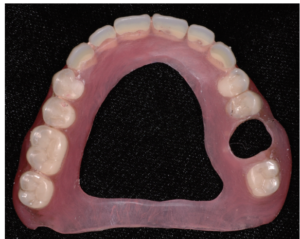
Fig. 3. Trimmed flexible denture.