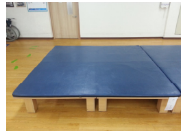
Fig. 2. Mat

앉아서 전·후, 좌·우로의 활동을 위하여 공중그네(Figure 7)를 사용하여 앉은 자세에서 치료사가 수동적으로 전·후로의 움직임 2분 30초 동안 시행한 후 좌·우로 움직임을 2분 30초 동안 시행하였다.