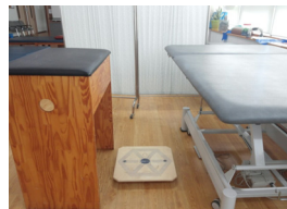
Fig. 6. Rocker Board