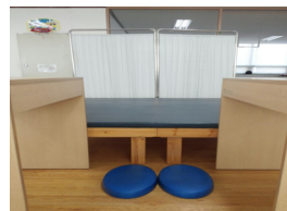
Fig. 4. Stability Trainer