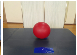
Fig. 3. Swiss ball