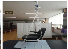
Fig. 7. Trapeze