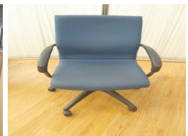
Fig. 5. Swivel chair