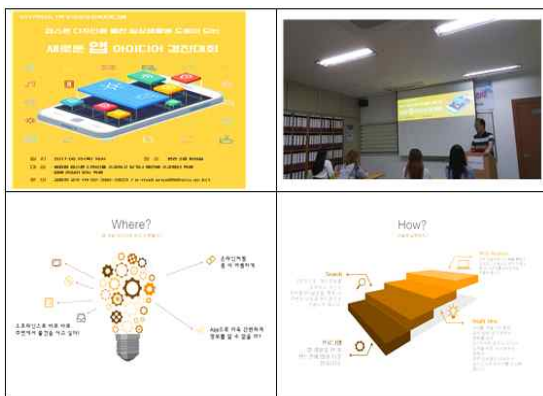
<그림 5> 캡스톤 경진대회

개인 평가는 팀 구성원들이 팀 구성 단계에서 만들었던 규칙문과 임무 규정문들에 따라 회의와 산출물에 대한 팀원들의 평가를 바탕으로 담당 교수가 평가 하였다. 또 학기 말에 프로젝트로 완성된 것을 바탕으로 경진대회를 열어 평가를 하였다. 아래 <그림 5>는 학생들의 아이디어를 바탕으로 한 캡스톤 경진대회의 모습이다.