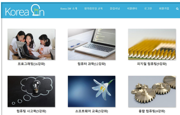
Fig. 3. Interface of System and Contents

설계된 콘텐츠는 2014년부터 2016년까지 전문가 19명이 참여하여 단위모듈을 가진 애니메이션 자료와 동영상자료의 형태로 개발하였다. 애니메이션 학습콘텐츠의 경우 교육콘텐츠 개발 전문팀에 의해 개발하였으며, 동영상 학습콘텐츠는 소프트웨어교육의 경험이 있고 초중등교사 연수 경험이 풍부한 현장 교사가 참여하여 개발하였다. 그림 3은 온라인 사이트의 메인화면과 콘텐츠의 구성 화면이다. 콘텐츠의 구성은 전문가 집단의 설계 과정을 거쳐 선정된 컴퓨터과학, 프로그래밍, 피지컬 컴퓨팅, 컴퓨팅 사고력, 소프트웨어 교육, 융합 컴퓨팅의 6개 영역을 중심으로 하여 강좌를 구분하여 개발하였다.